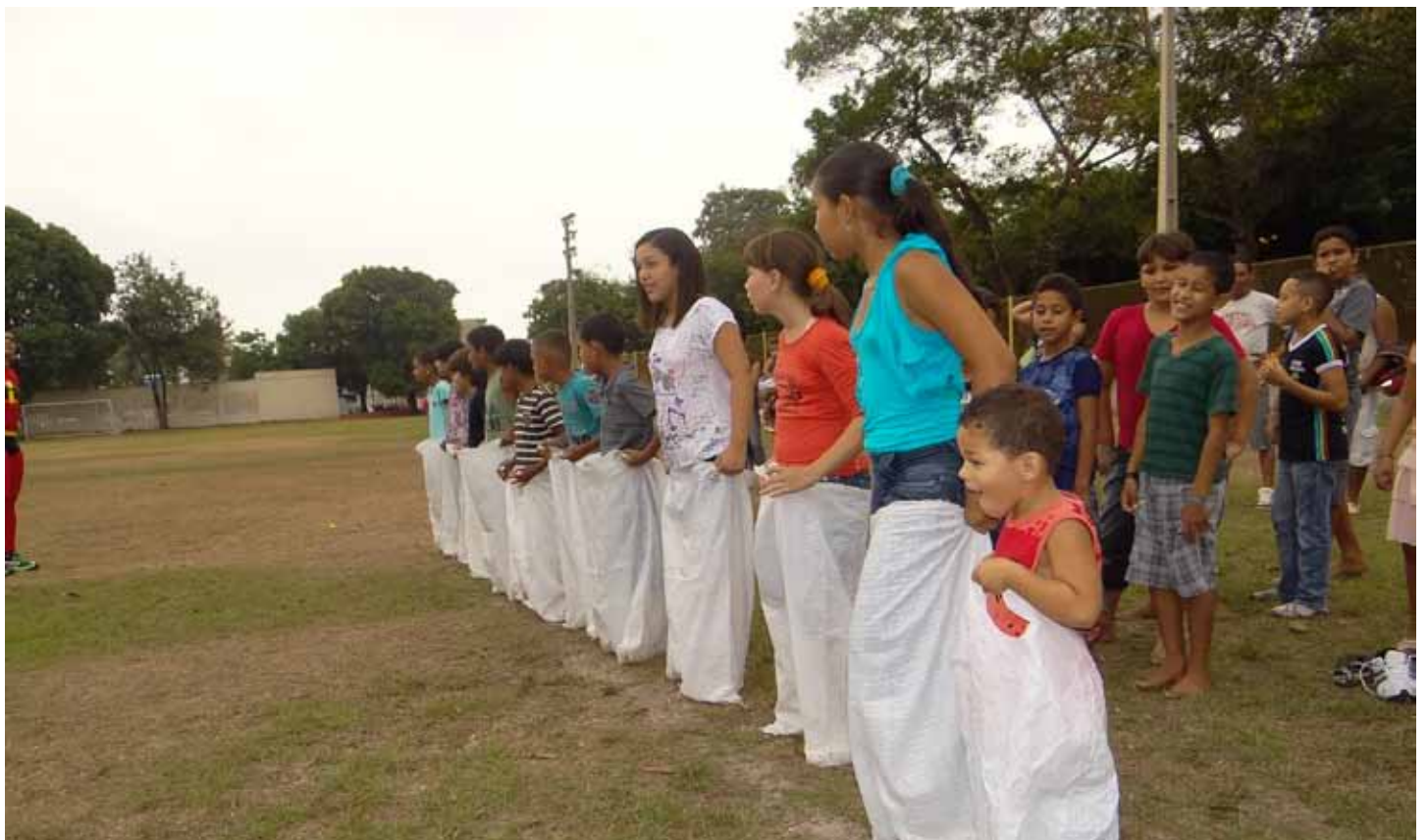
A programação alusiva ao Dia das Crianças foi realizada pelo grupo de voluntários SINOBRAS em Ação

colaboradores SINOBRAS, ficamos todos muito felizes em poder proporcionar este momento a eles".