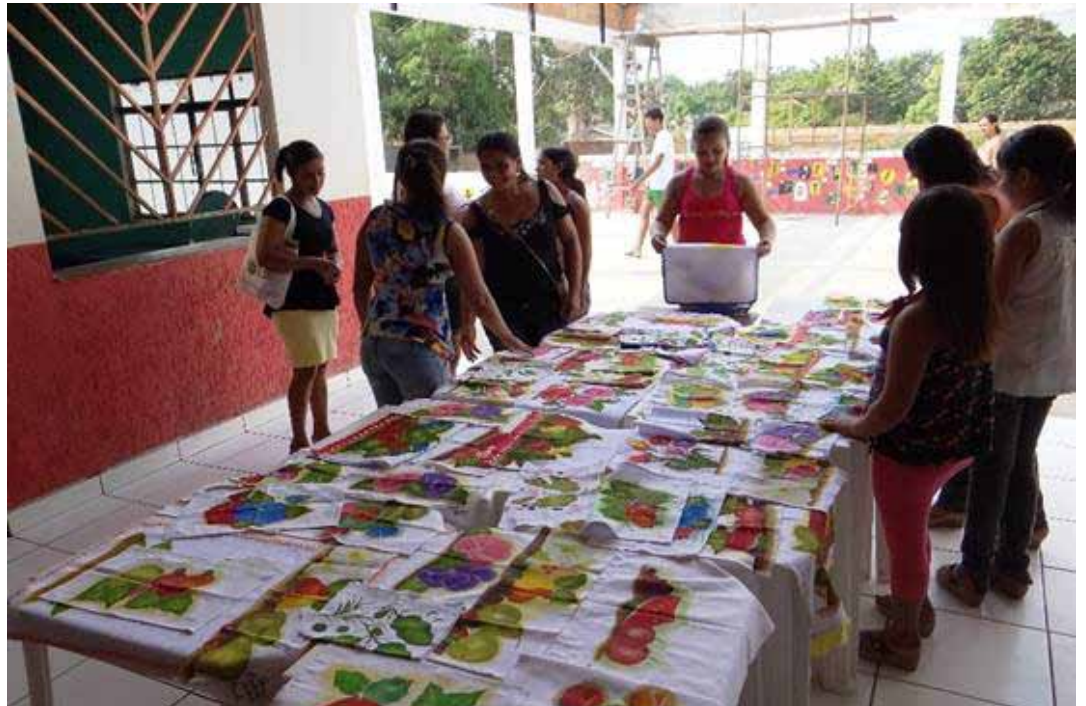
Exposição de peças produzidas pelas mulheres que participaram do curso de pintura em tecido

Foram formadas duas turmas, com aulas ministradas três dias por semana. Ao final do curso, o objetivo foi fazer com essas mulheres dominassem as técnicas e fossem capazes de produzir os materiais por conta pró-