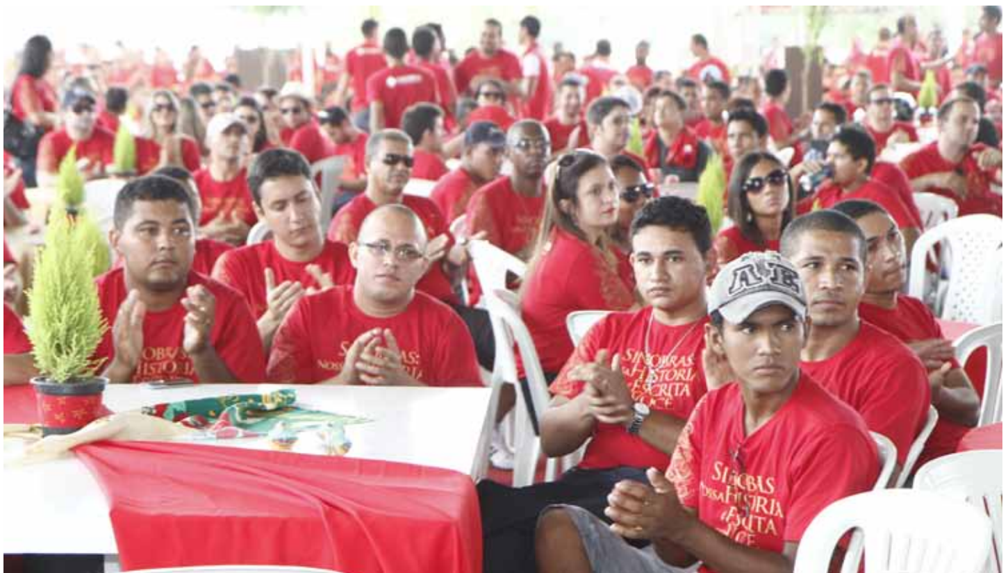
Evento reuniu mais de 1.200 colaboradores no Parque de Exposições de Marabá, com música, dança e sorteio de prêmios

para mim foi um momento de união entre os colaboradores, diversão e muita alegria. A festa foi sensacional e tudo estava ótimo", encerrou ela.